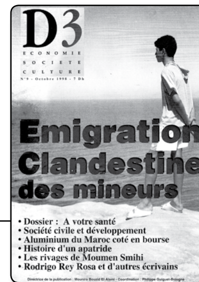
Portada del semanario D3 : «Emigración clandestina de menores», 1998

La prensa del norte se ocupó también de informar sobre la situación de los niños marroquíes en las calles de Ceuta; 13