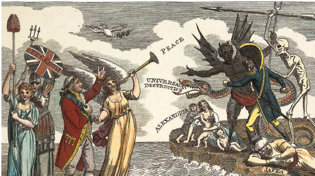
[9] Ilustración de autor desconocido que alienta en 1803 a los ciudadanos ingleses a defender la monarquía frente a los desmanes que ha causado al otro lado del canal de la Mancha la Revolución Francesa.