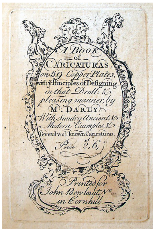
[6] Portada del que se considera primer manual para la realización de caricaturas, obra de Mary Darly.

ocupó el puesto de «pintor del rey de Francia, su gabinete y su jardín» 3 . Pero todas estas creadoras constituyen excepciones, en ámbitos además especializados y de clase, ajenos por completo a las sinergias posteriores con la esfera pública y la cultura popular. Apenas medio siglo después, Mary Darly tiene ya la oportunidad de obtener un gran éxito a pie de calle con el que se considera primer manual para la realización de caricaturas: A Book of Caricaturas, on 59 Copper Plates, with Ye Principles of Designing in that Droll & Pleasing Manner (1762), un libro centrado en temas políticos, sociales y mundanos [6] y dirigido a «jóvenes damas y caballeros» 4 .