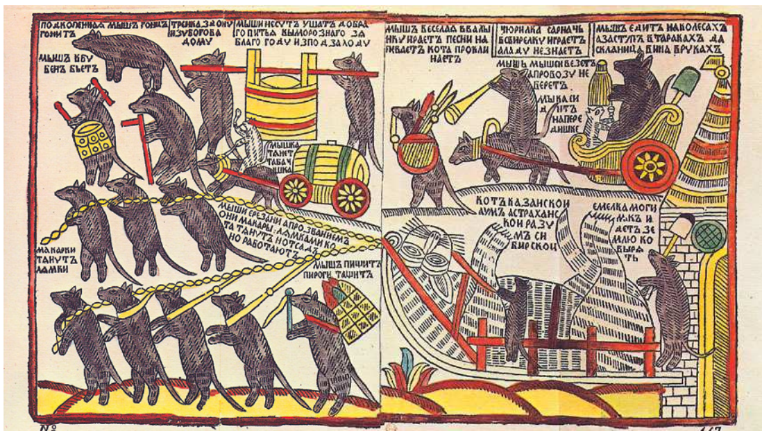
[10] Ejemplo temprano de popular print o edición popular de literatura ilustrada: xilografía coloreada a mano hacia 1766 que critica reformas del emperador Pedro I de Rusia (1672-1725).