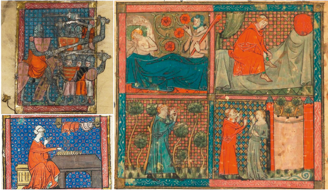
[4] Varios trabajos atribuidos a la ilustradora francesa Jeanne de Montbaston.

testimonia cómo los movimientos reformistas en el seno de la fe cristiana traen consigo una explosión de religiosas dedicadas en los conventos del norte de Europa a la escritura e ilustración de libros 1 . En paralelo, la francesa Jeanne de Montbaston, activa entre 1320 y 1355, ejemplifica el florecimiento en las cortes continentales de autoras no solo de tratados varios, misceláneas, libros de horas y textos devocionales [4], sino también de manuscritos heterodoxos para regalo 2 .