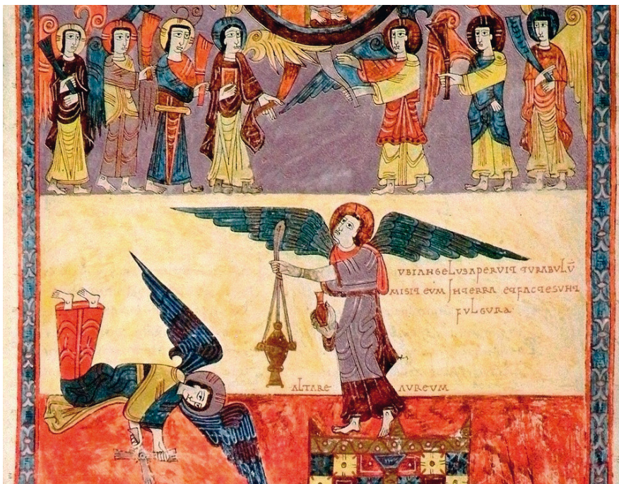
[3] Muestra del trabajo de Ende para el Beato de Gerona .

Antes habían existido, como es lógico, ilustradoras brillantes. Sin ir más lejos, en la Alta Edad Media nos encontramos con la misteriosa Ende (?-?), creadora de iluminaciones y miniaturas para el Beato de Gerona (975) y otros manuscritos [3]. En el Renacimiento de los siglos XIV y XV, la alemana Sibylla von Bondorf (1450-1524)