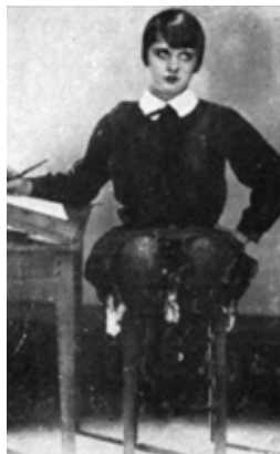
La escritura automática

mentos de apreciación de gran estilo a una crítica desamparada, de permitir una reclasificación general de los valores líricos y de ofrecer una llave capaz de abrir indefinidamente esta caja de doble fondo a la que llamamos hombre. (A. B.) Durante años, he contado con el cauce torrencial de la escritura automática para limpiar definitivamente las caballerizas literarias. A este respecto, la voluntad de abrir todas las grandes esclusas permanecerá, sin ninguna duda, como la idea generatriz del surrealismo. (A. B.)